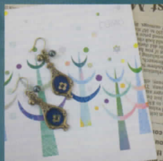
アクセサリ ステーショナリー COMO