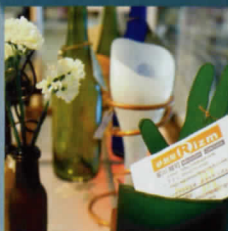
ボトル再生雑貨 ボトルコ