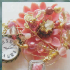
針金アクセサリ チュウゲン