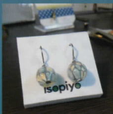
ガラスアクセサリ isopiyo